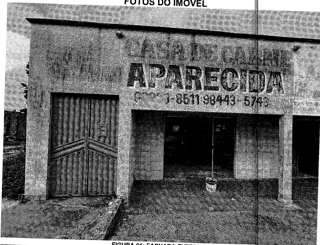
FIGURA 01: FACHADA EXTERNA