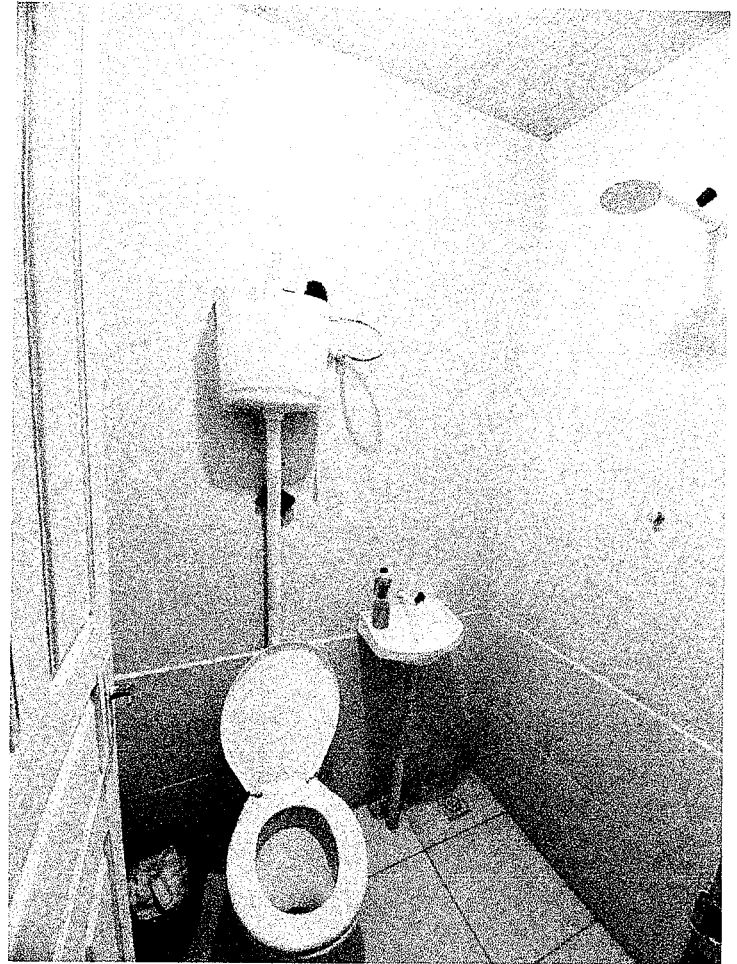
FIGURA 5: BANHEIRO