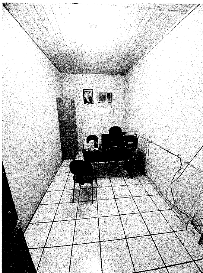
FIGURA 4: SALA DE ATENDIMENTO