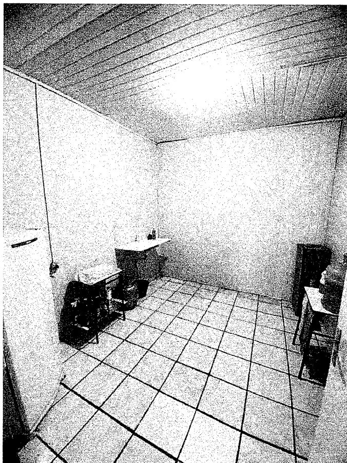
FIGURA 3: COPA