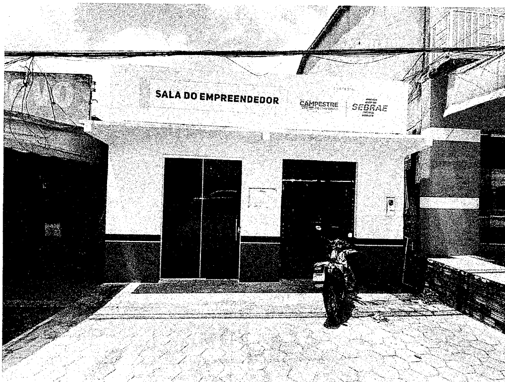
FIGURA 1: FACHADA FRONTAL