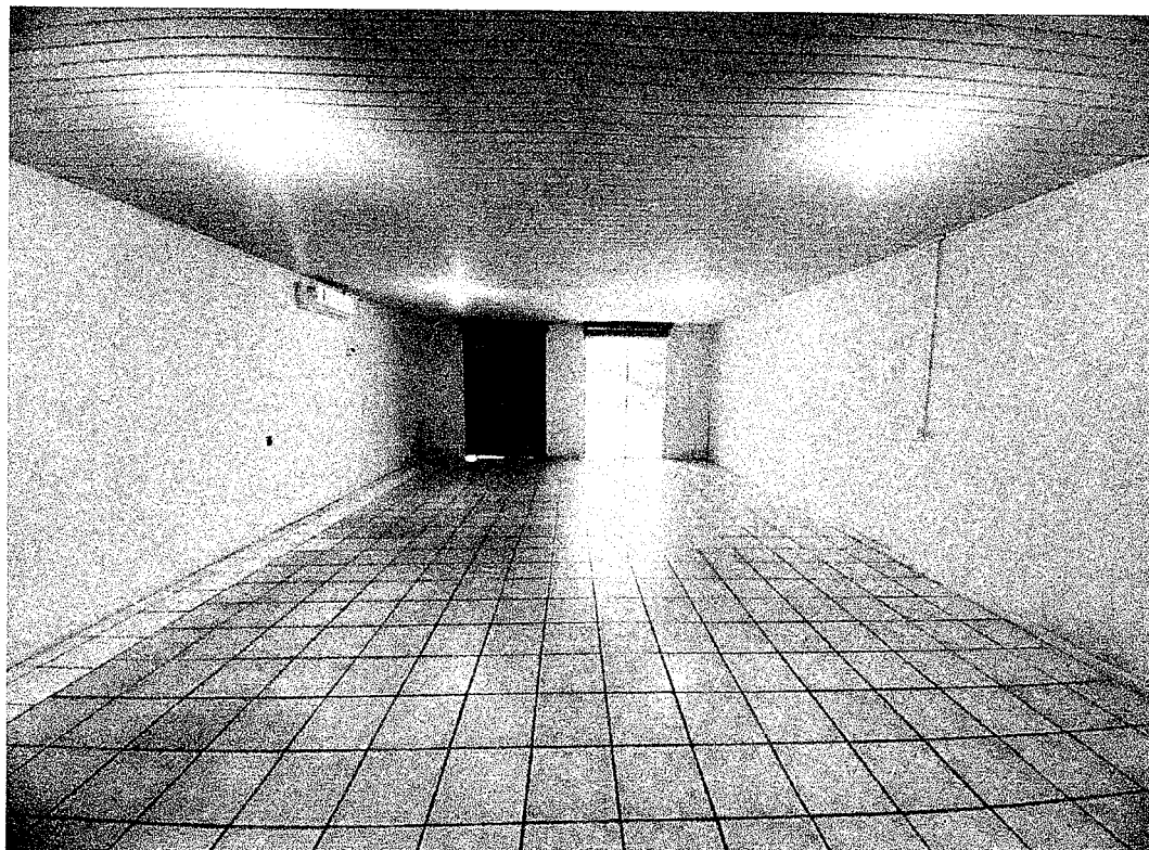
FIGURA 2: SALÃO DE REUNIÕES