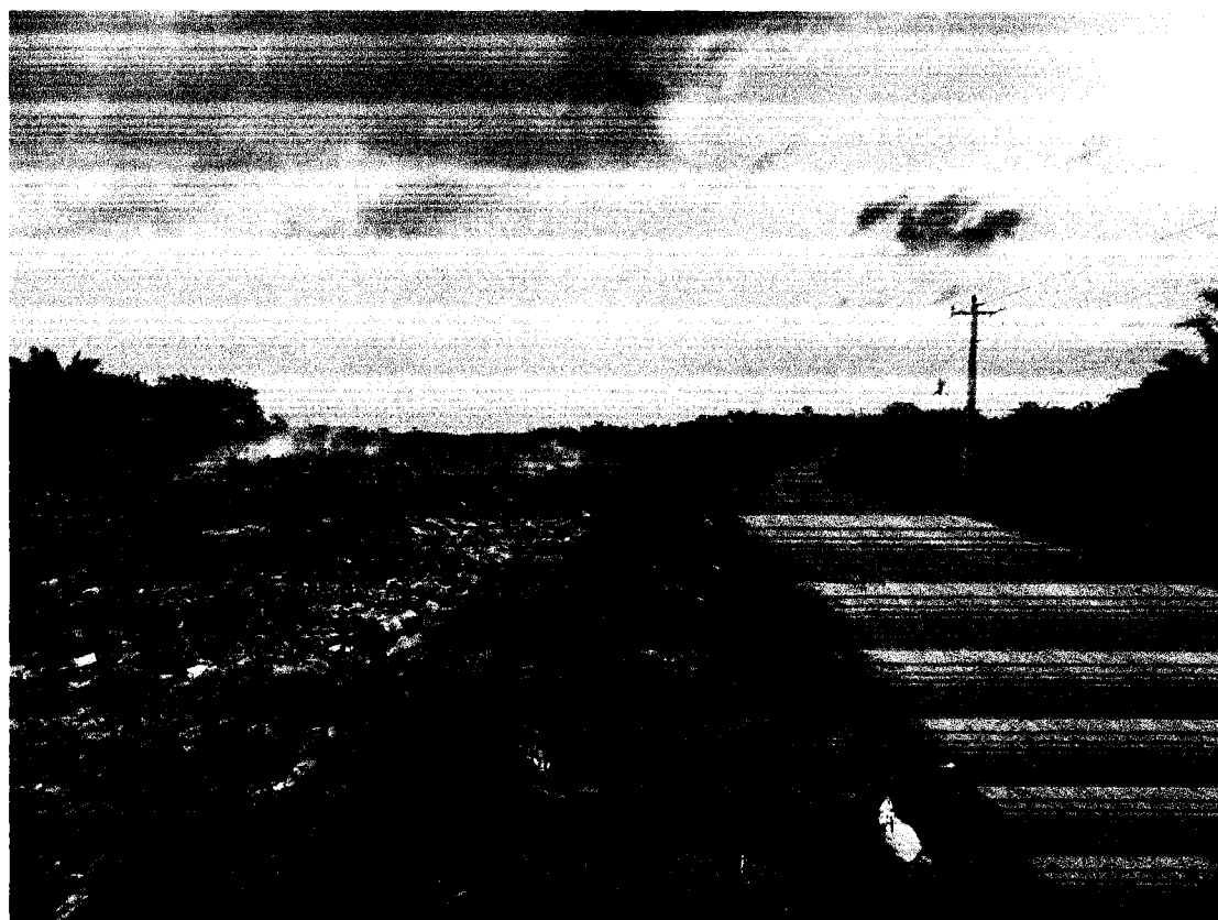
FIGURA 2: DEPOSITO DE RESÍDUOS SÓLIDOS