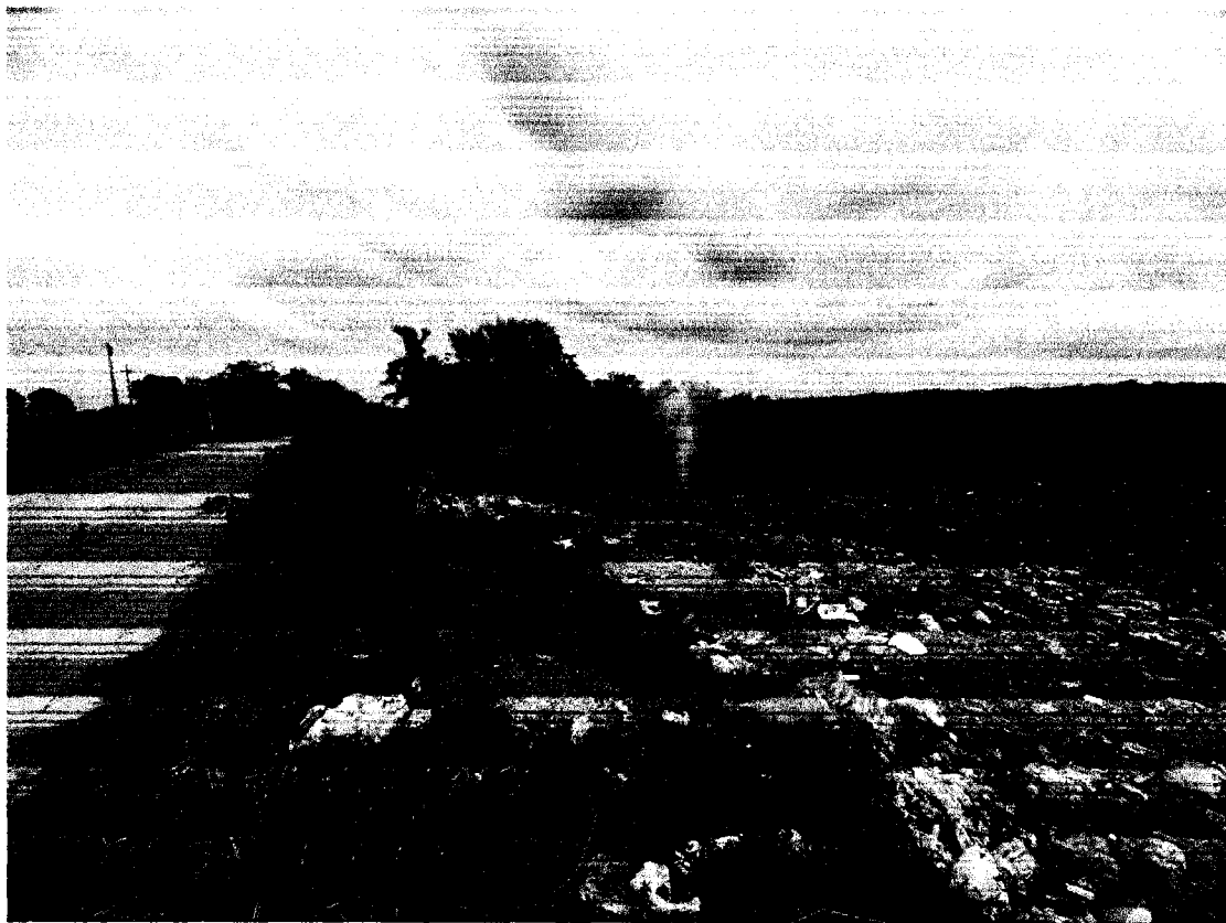
FIGURA 1: DEPOSITO DE RESIDUOS SÓLIDOS