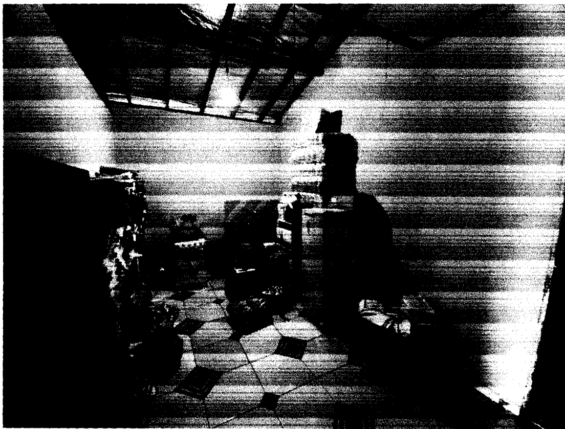
FIGURA 3: DEPOSITO E COPA