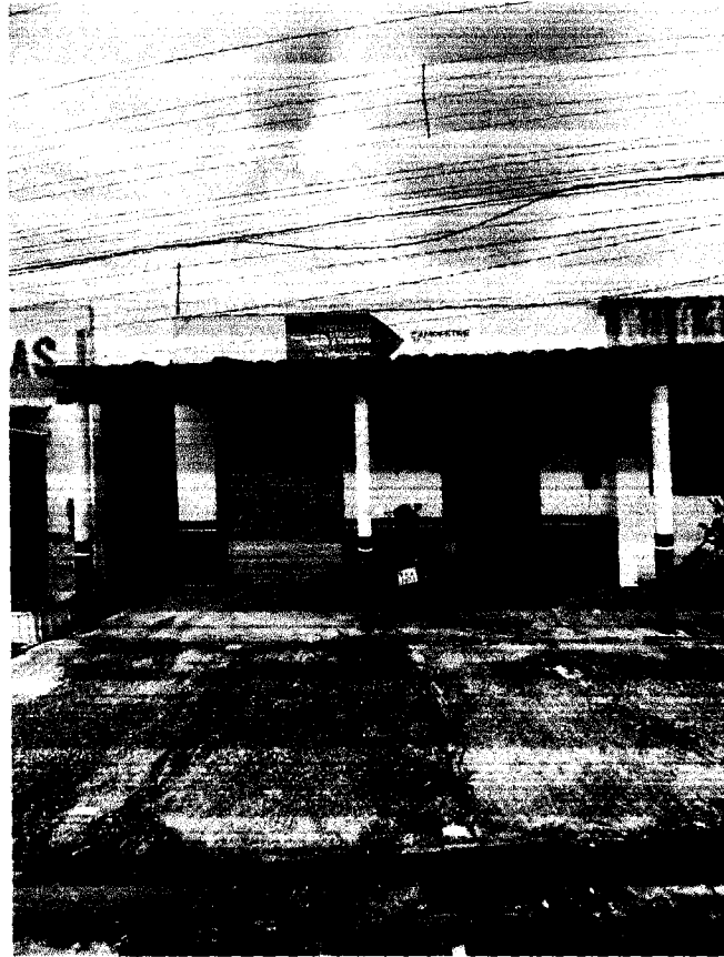
FIGURA 1: FACHADA FRONTAL